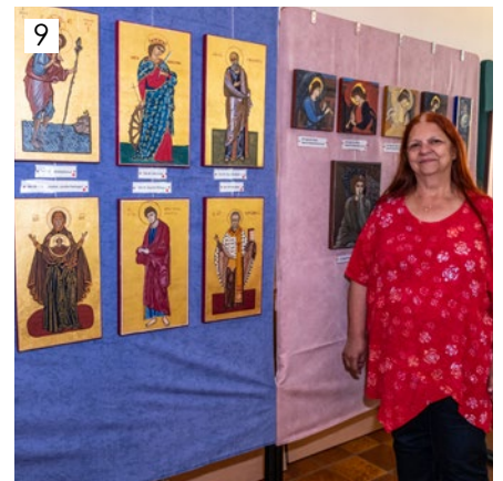
1 Trachtenmusik Leopoldskron-Moos, 2 Fronleichnam, 3 Palmsonntag, 4 Gründonnerstag, 5 Karfreitag, 6 Osternacht mit Alt-Erzbischof Alois Kothgasser, 7 Ostermorgen, 8 50jähriges Priesterjubiläum Pfarrer Gustl Fuchsberger, 9 Ikonenausstellung Christine Deußner